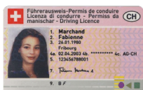
Permis de conduire Copie recto